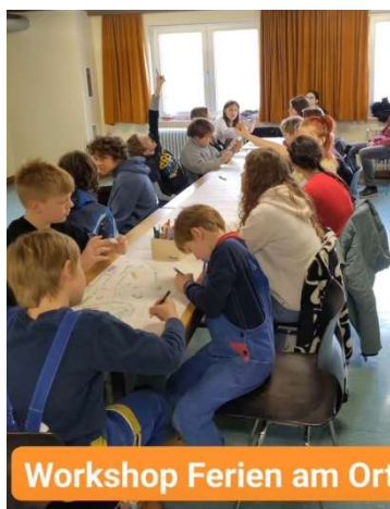
Workshop Ferien am Ort

„ Ferien am Ort “ wird bei uns nicht nur bunt – sondern bleibt bunt.