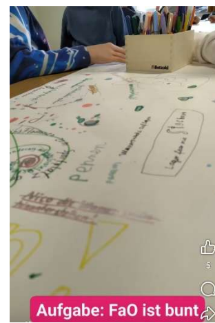
Aufgabe: FaO ist bunt